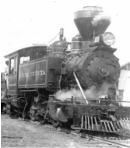
185- Locomotora Maracabo del Ferrocarril de Cúcuta.

El circuito de circulación de la historia de Cúcuta Norte de Santander es una iniciativa de la Fundación Superior de Estudios Superiores Comfanorte-FESC, este nace y se proyecta gracias a la necesidad de sentido de pertenencia por la ciudad de Cúcuta, escenario de grandes avances económicos del país, de grandes historias con episodios vividos antes y después del terremoto. Este proyecto es importante y un factor clave para lograr fortalecer el sentido de pertenencia de los ciudadanos, el hecho de que sepan y recuerden la historia, el aporte de la ciudad a Colombia, y qué mejor manera para lograr un gran impacto desde un medio artístico-cultural que se apoya en la tecnología (modelamiento 3D y realidad aumentada).