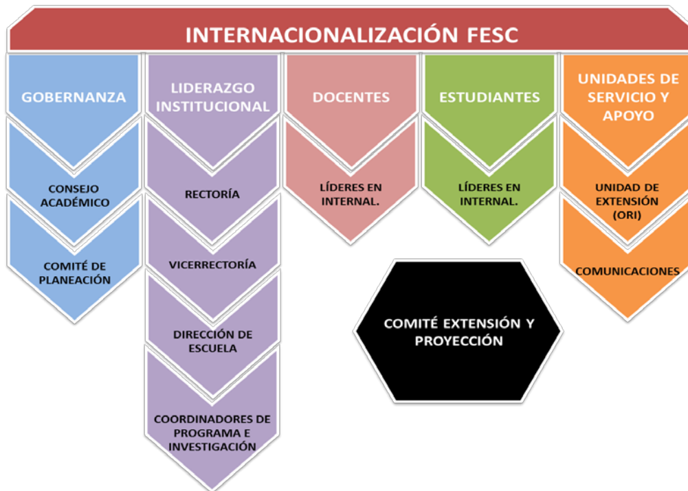
Imagen 1. Actores de la Internacionalización en la FESC

ARTÍCULO 8: Actores de la Internacionalización: La FESC agrupa los autores de la internacionalización por gobernanza institucional, liderazgo institucional, docentes, estudiantes, unidades de servicio y apoyo y comité de Extensión y Proyección, soportada en la importancia de la transversalidad partiendo de la misión, la cual se estructura en las funciones misionales de la educación superior información consolidada en la siguiente Imagen.