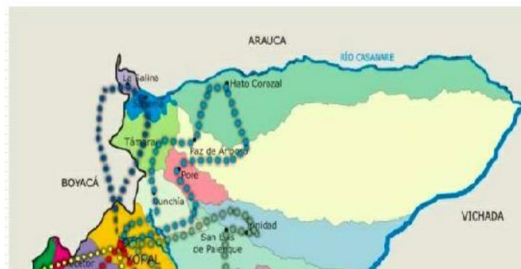
Figura 7. Ubicación regional y rutas del proyecto.