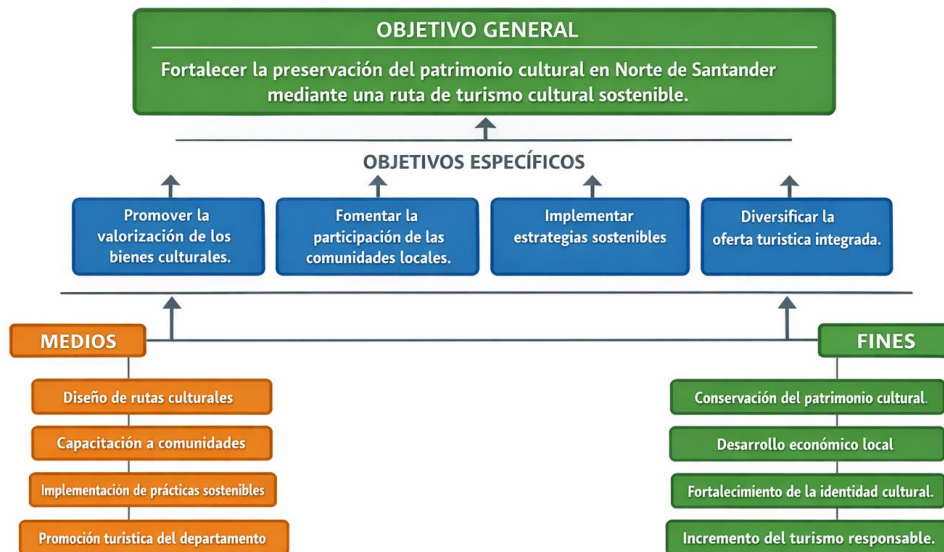
Figura 2. Árbol de objetivos.